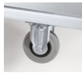
Ruedas fijas sin freno