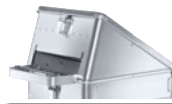
Lock for folder, Order No. 40 895

Contenedor de 70L.: → Paredes sin nerviaciones de refuerzo.