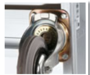
Ruedas giratorias atornilladas a la estructura